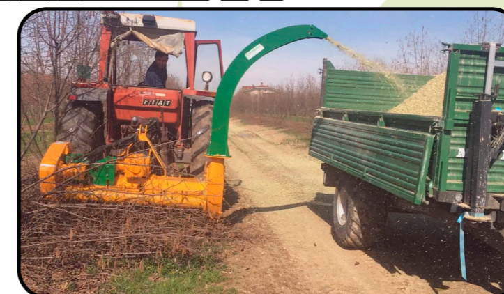
▶ Разгрузочный желоб