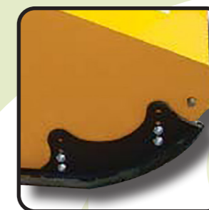
▶ Удлиненные салазки