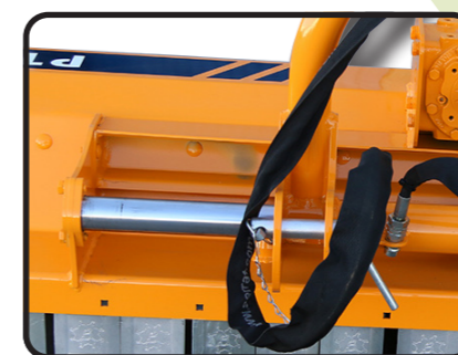
▶ Гидравлический сдвиг