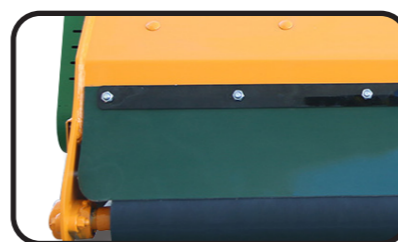
▶ Задняя защитная резина