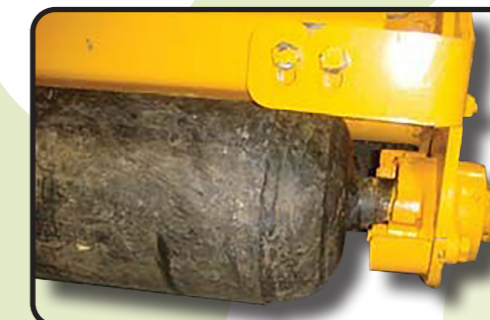
▶ Усиленный ролик