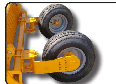
▶ Опорные регулируемые колеса