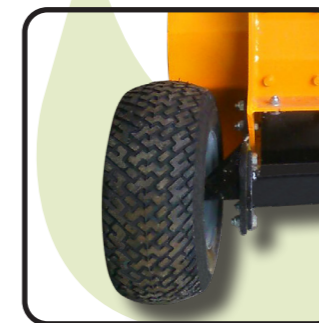
▶ Опорные колеса