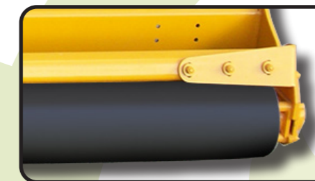
▶ Задний каток