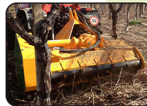
▶ Назад или вперед позиция