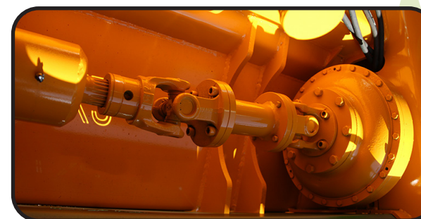
▶ Турбо сцепление