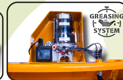
▶ Централизованная смазка