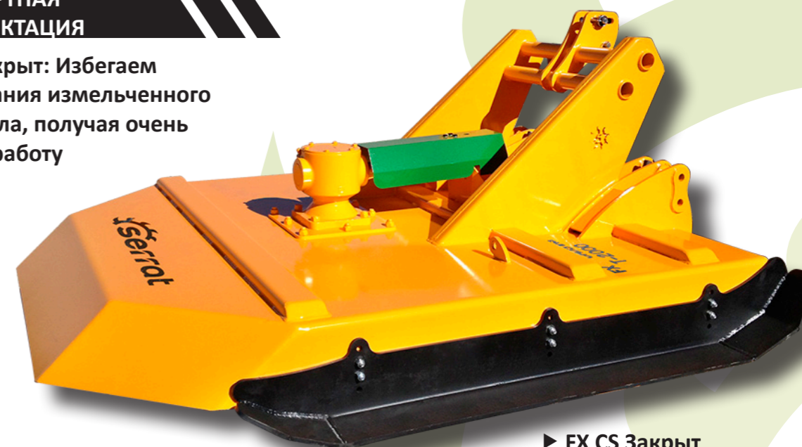
▶ FX CS Закрыт