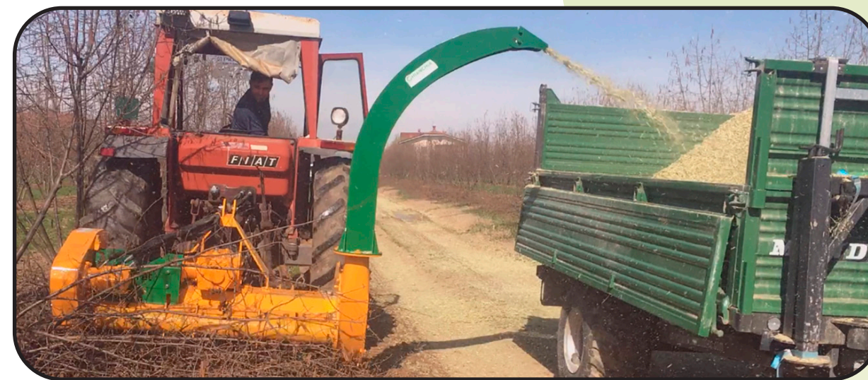
▶ Разгрузочный желоб