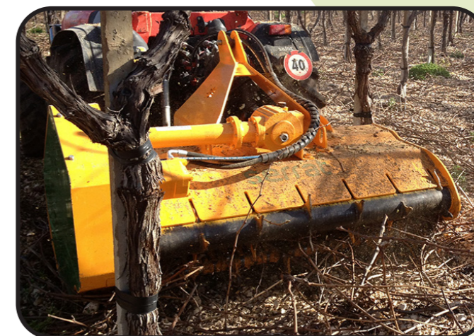
▶ Назад или вперед позиция